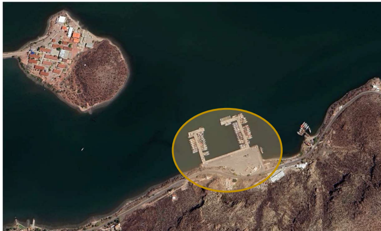
Ubicación del proyecto.

La obra se desarrollará en carretera al varadero Nacional km 6.6 Las Playitas en las instalaciones de ASIPONA, en Guaymas, Sonora.